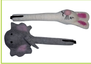
1 „Tierischer Kugelschreiber“ verschiedene Motive