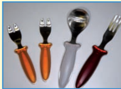
Pasta oder Pommes Picker für Kinder, je 1 Set