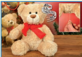
1 Plüschteddy mit Musik zum Aufziehen