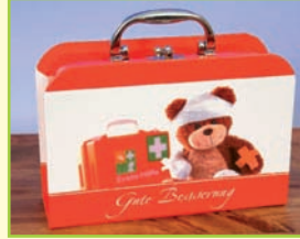
1 „Gute Besserung“ Koffer