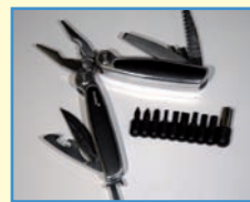
1 Ricardo Tool Tec mit 10 Funktionen