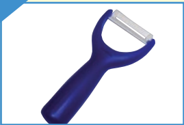
1 Spargelschäler aus Ceramic verschiedene Farben