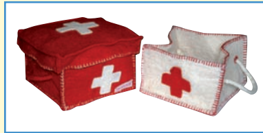
Erste Hilfe Backpack aus Filz weiß/rot oder rot/weiß, 1 Stück