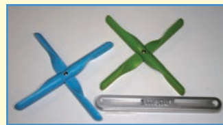
1 Menü-Design-Untersetzer verschiedene Farben