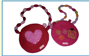
1 Kindertasche aus Filz verschiedene Motive