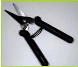
1 Ricardo Qualitätsschere